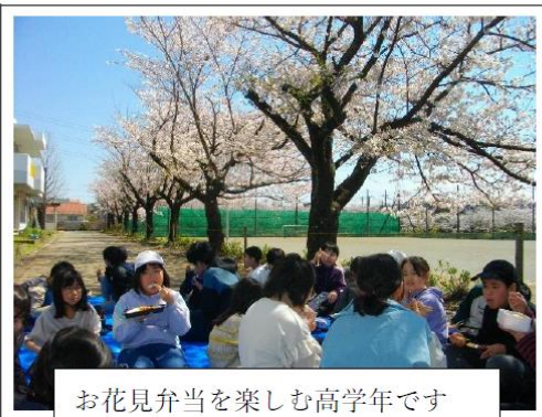
お花見弁当を楽しむ高学年です

有吉小アフタースクール（以下AS）のスタートを祝うかのように桜も満開となりました。初めて利用する1年生は少し緊張した様子でしたが、入学式を終え、2週間が過ぎ、新しい生活にも慣れてきたようです。ただこれまでと違い、小学校、ASと環境が変わり、生活の変化も大きいので疲れもたまってくるかもしれません。職員一同、見守りを心がけていますが、ご家庭でもお子様が安心できるよう、声掛けなどお願いいたします。