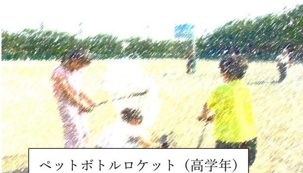
ペットボトルロケット(高学年)