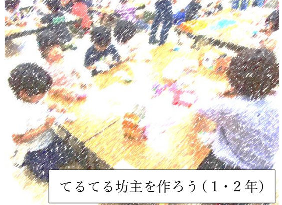
てるてる坊主を作ろう(1・2年)

5月の体験プログラムでは、みんなで作る坊主を作りました。そのかいもあってか、5/30(土)の運動会は、ほぼ快晴の素晴らしい天気の下で行うことができました。有吉小AS児童のみんなの願いがかなったのだと信じています。ASの子供たちも応援団長をはじめ、いろいろなところで活躍している様子に頼もしく感じる次第です。