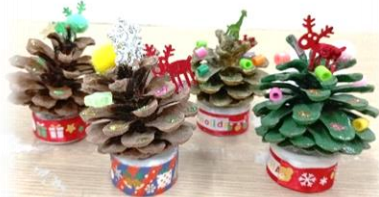
【松ぼっくりツリー】