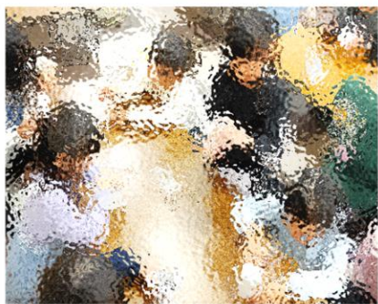
【ガチャガチャマシーン】