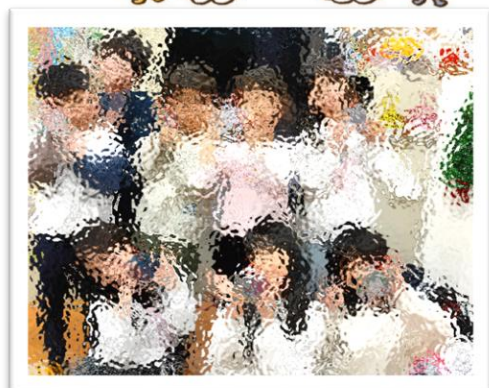
【スノードーム作り】