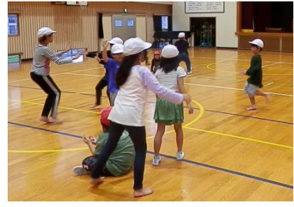
10/9 鬼ごっこ (犬と犬屋)