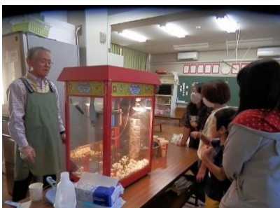
10/15 映画会でポップコーン