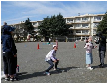
10/11 秋休みのパン食い競争