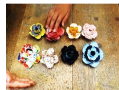
カメラアブローチ