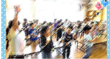
こいのぼりけん玉をつくろう