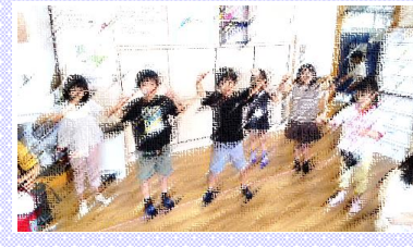
ぶんぶんゴマを作ろう