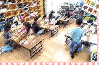
レシピであそぼう