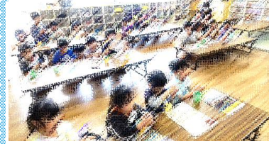
こいのぼりけん玉をつくろう