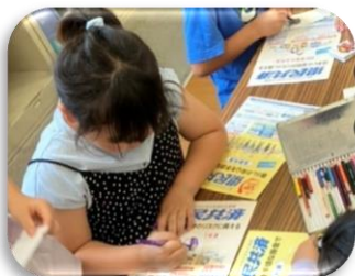
【ぴよんぴよんガエル作り】