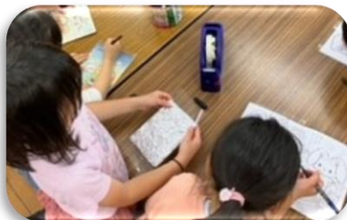
【キラキラボード作り】