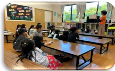
【英会話の先生による読み聞かせ】