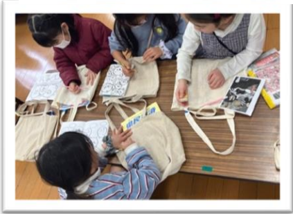
【トートバックリメイク】