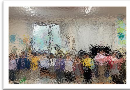
【新入生かんげい会】