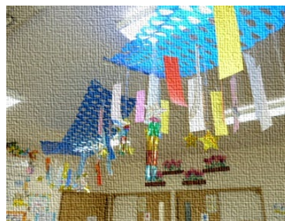
今年も七夕の短冊に願い事を書きました。